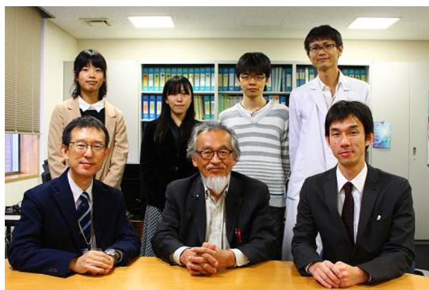
公演終了後、部長室にて集合写真